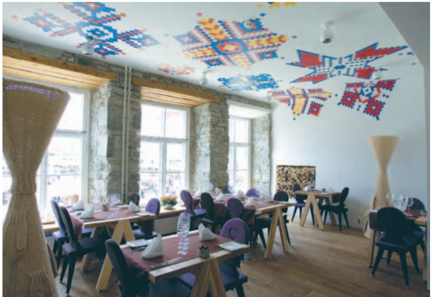
► Restorani Kaera-Jaan rahvuslikkust rõhutatav disain on napp, kuid läbimõeldud.

Ma ei tea, aga jaanipäeva paiku on mul ikka tahtmine oma kunagisi klassikaaslasta kallistada. Häid pühi kõigile!