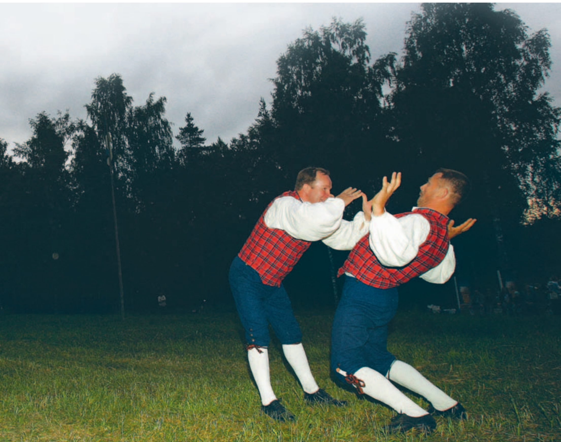
▶ Jaanipäev möödunud aastal Rocca al Mares Eesti Vabaõhumuuseumis, Tantsud Jaani auks.