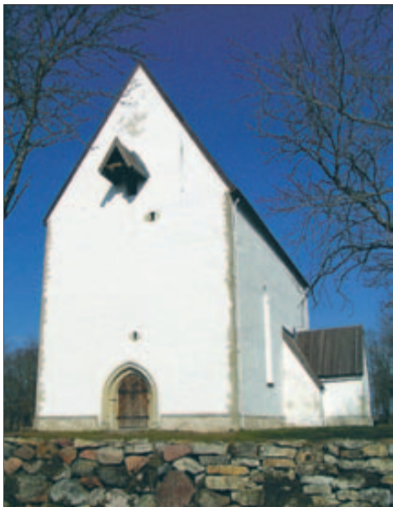
► Muhu kindluskirik on Eestis vanimaid.