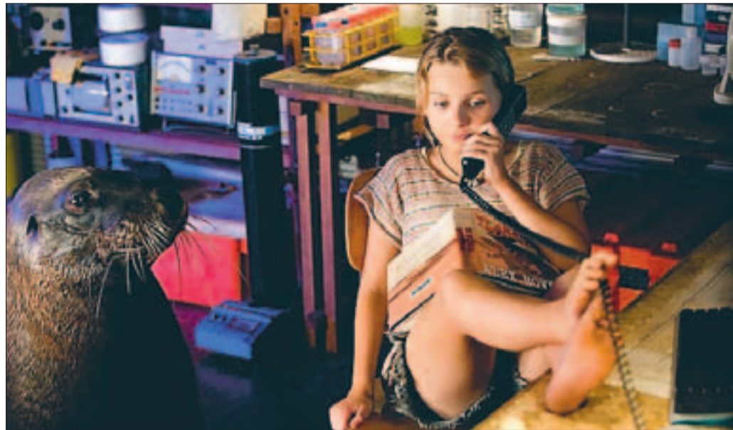
PP ► Nim (Abigail Breslin) asub koguperekomöödias päästma omanimelist saart.

Filmi lavastas abielupaar Mark Levin ja Jennifer Flackett, nende kirjutatud stsenaariu- mi aluseks on Wendy Orri roma- maan.