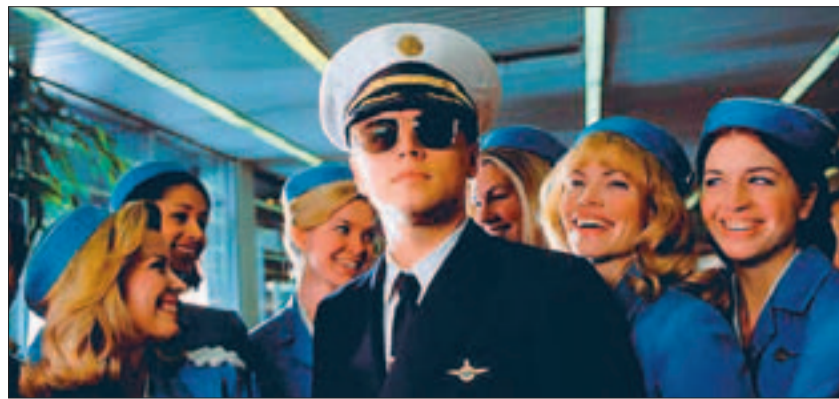
▶ Leonardo DiCaprio

USA 2002. Režissöör: Steven Spielberg. Osades: Leonardo DiCaprio, Tom Hanks, Christopher Walken, Martin Sheen