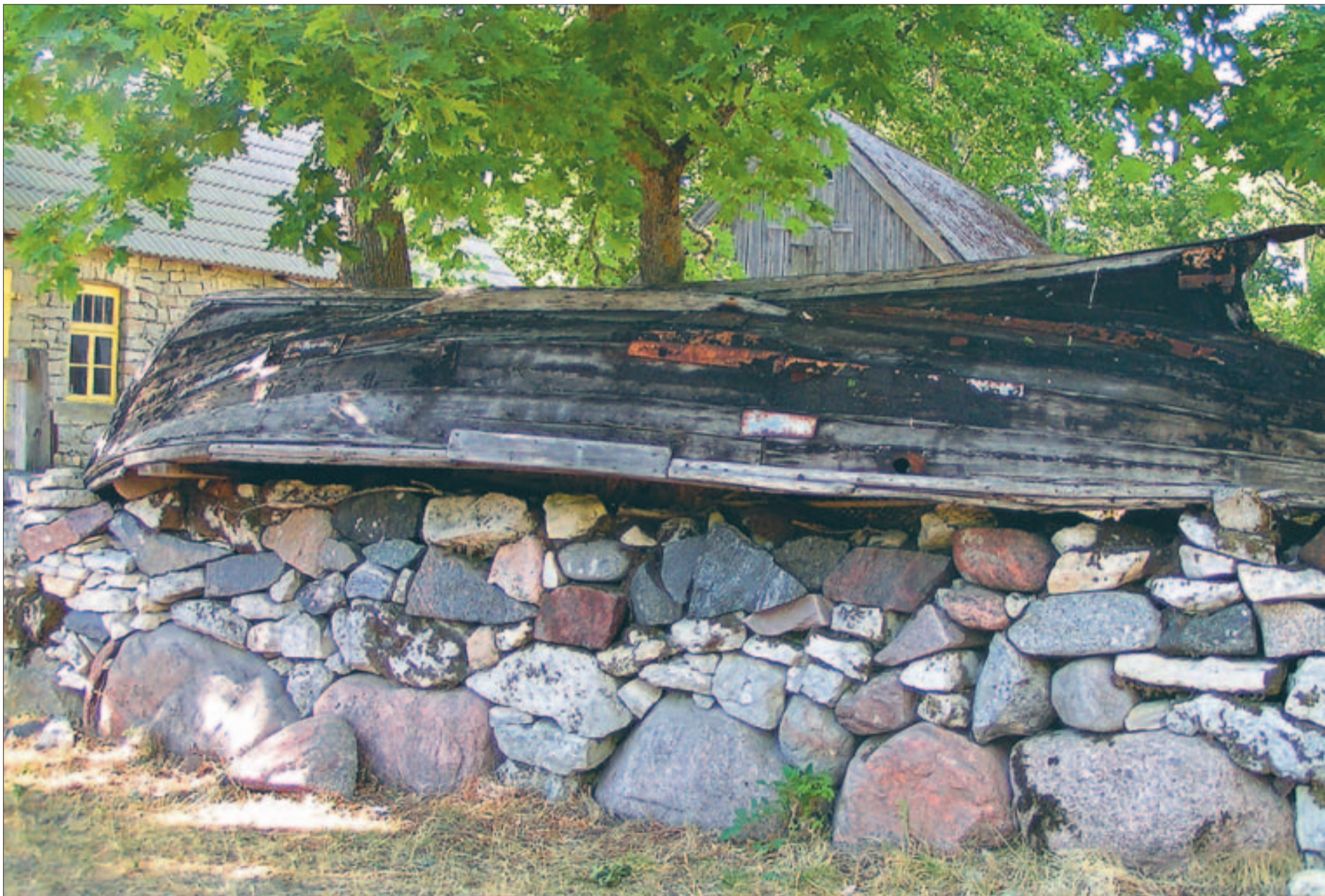
► Oma aja ära elanud paadid asetatakse Koguva külas aedadele.