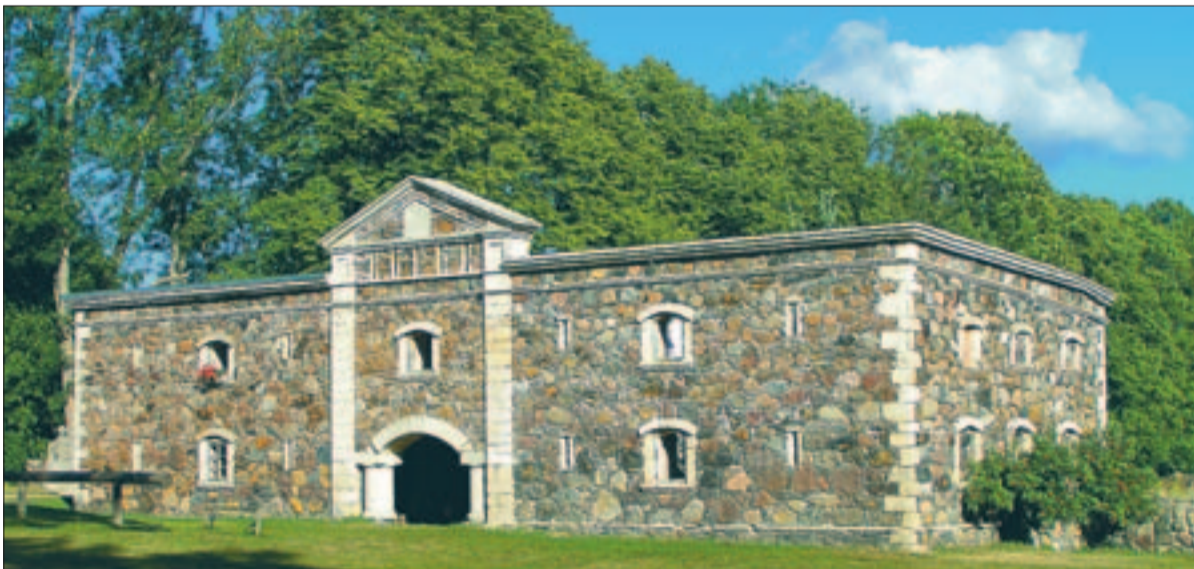
► 16. sajandisse ulatuva Pädaste mõisa renoveeritud hooned mõjuvad piltpostkaartidena.

näoliselt küll hilisemast rahu- perioodist. Ent vaade patarei harjal üle kadakaste rannaniitude merele on Võikülas hingekosutav – selle nimel tasub ka kilomeetreid munakividel loksuda.