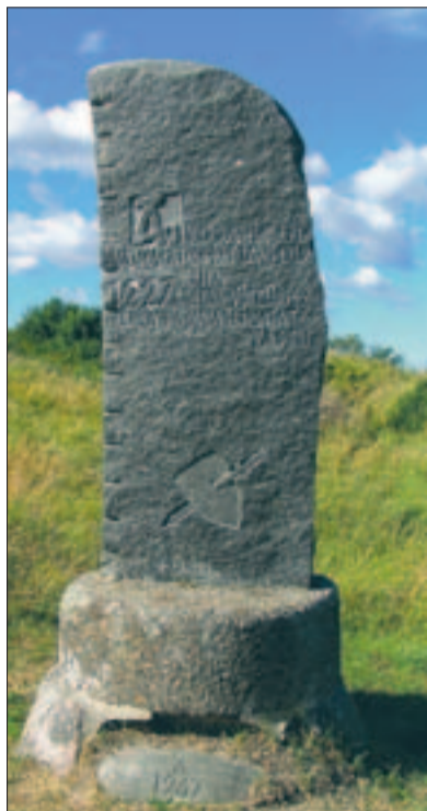
► Mälestus-sammas Muhu linnuse õuel.