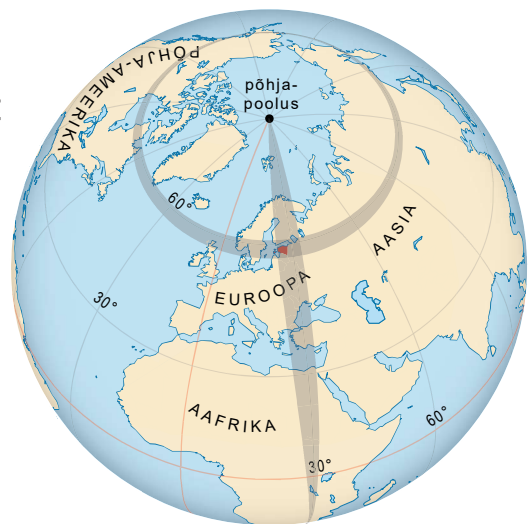
Eesti asukoht Maal