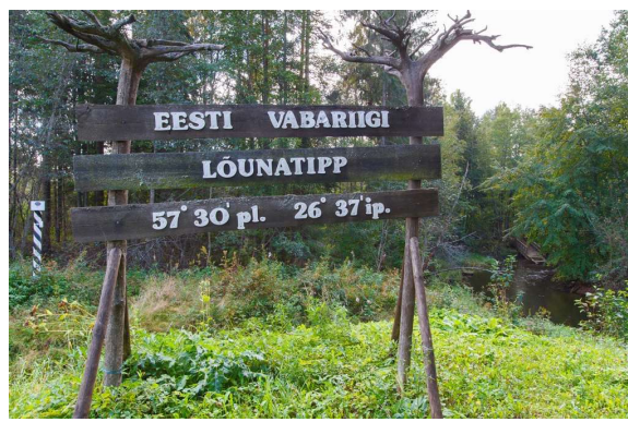
Eesti lõunapoolseim äärmuspunkt Karisöödil