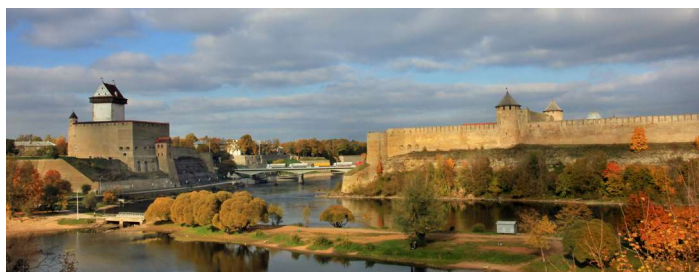
Eesti idapoolseim äärmuspunkt Narva asub vasakul pool Narva jõge. Paremal pool jõge on juba Venemaa.