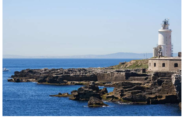
Euroopa lõunapoolsem äärmuspunkt Marroquí neem