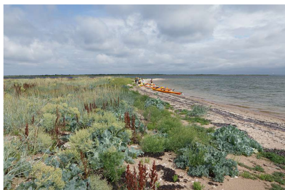
Eesti läänepoolseim äärmuspunkt Nootamaa saar