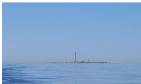
Eesti põhjapoolseim äärmuspunkt Vaindloo saar