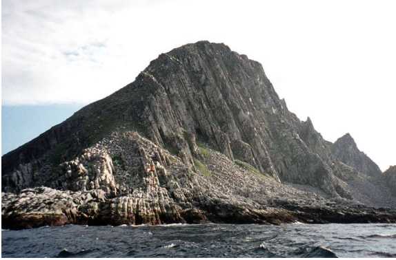
Euroopa põhjapoolsem äärmuspunkt Nordkinni neem