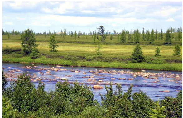
Euroopa idapoolsem äärmuspunkt Polaar-Uuralis