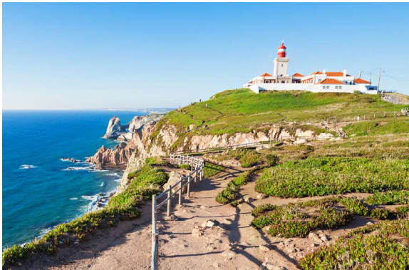
Euroopa läänepoolsem äärmuspunkt Roca neem