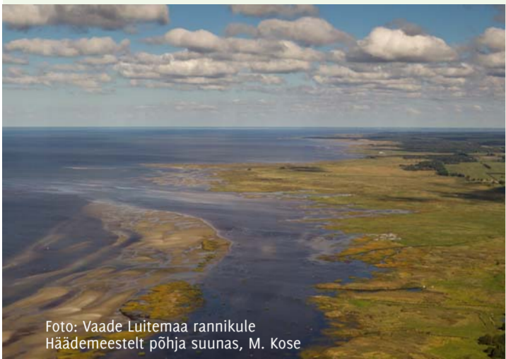
Foto: Vaade Luitemaa rannikule Häädeemeestel põhja suunas