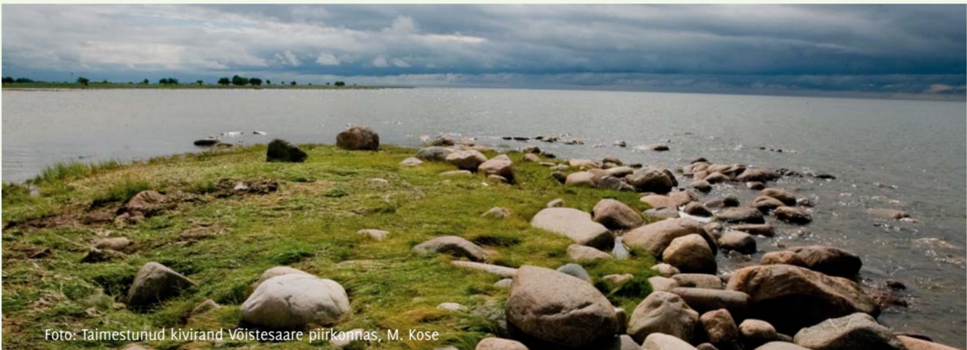
Foto: Taimestunud kivränd Võistesaares piirkonnas