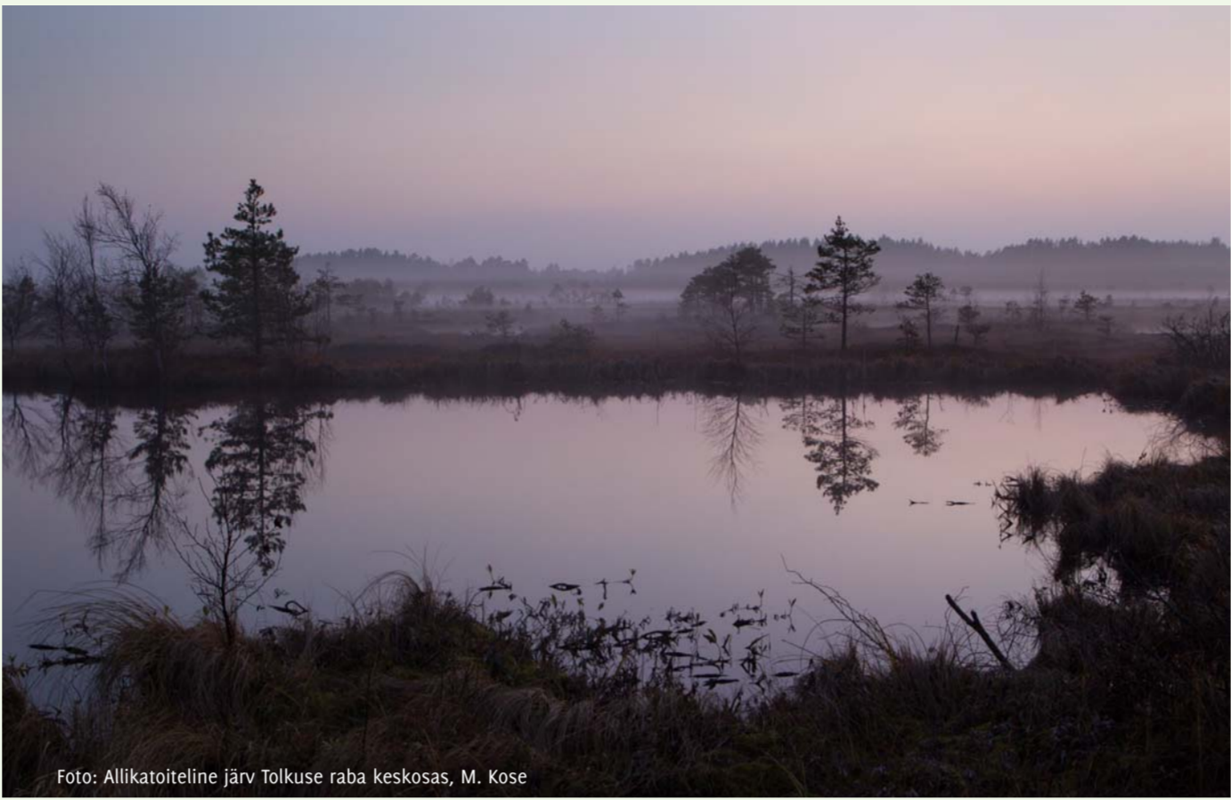
Foto: Allikatoimeline järv Tolkuse raba keskosas